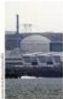
EDF de Flamanville.

ÉNERGIE Dans les premières semaines d'activité de la centrale nucléaire de Flamanville, EDF a commencé à livrer du combustible à la centrale de Flamanville. Le combustible nucléaire livré au site de l'EDF de Flamanville (Bretagne) sera utilisé pour produire de l'électricité. Cette étape marque le début de l'exploitation de la centrale de Flamanville et la première étape de la production d'énergie nucléaire. Le combustible est livré par camion à la centrale de Flamanville. Pour EDF, cette étape est essentielle pour la production d'énergie nucléaire.